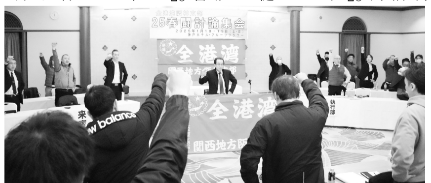
団結して大幅賃上げを勝ち取ろう!

分会よりエントリーがあり、金賞が日本コンテナ輸送分会の「トレーラー」、銀賞に日興サービ分会の「日興ニュース」、銅賞に大運分会の「潮」、奨励賞に全日検神戸分会の「検数労働」と新神戸セキユリテ分会の「SKS分会ニュース」が選ばれました。