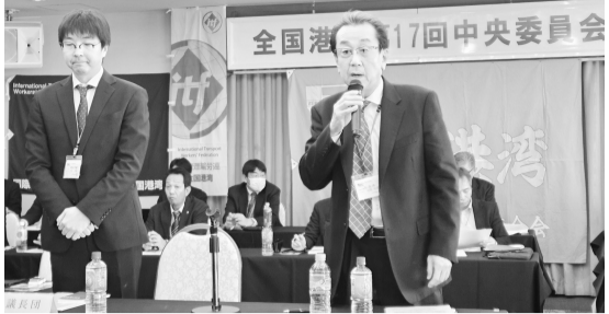
河野委員長が議長団を務めた

れに分配することが重要である」とし、全国の組合員と団結して体制的合理化に絶対反対することを力強く述べました。