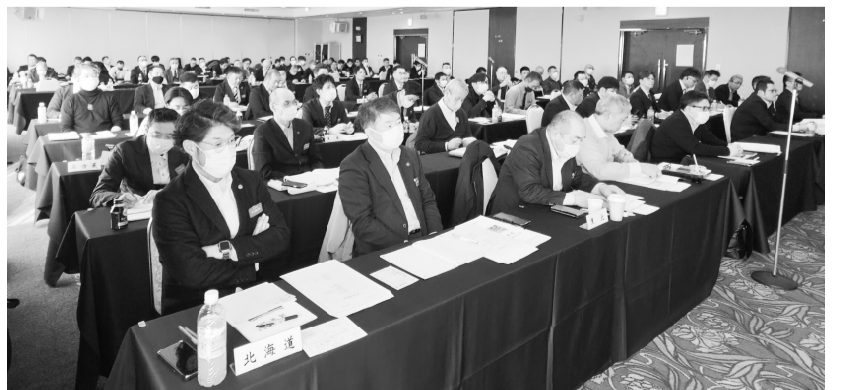
全国から106名が参加し開催された