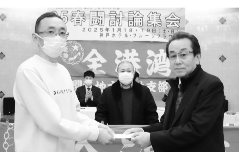
「トレーラー」が金賞に輝く